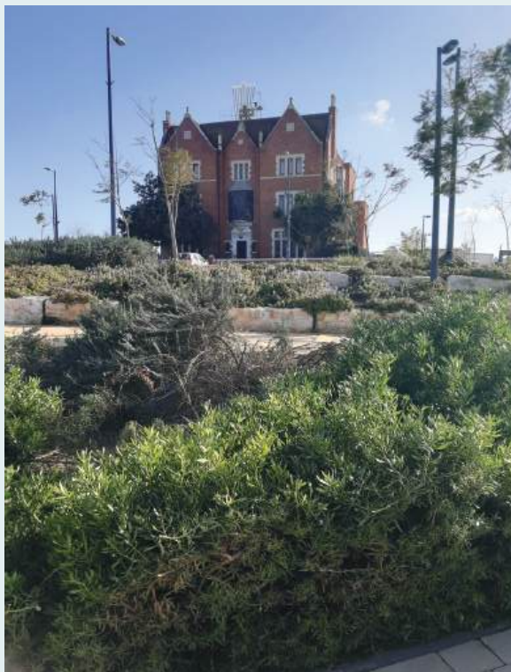
בית הכנסת "בגובהה של עיר"